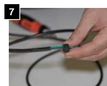
7 Feed additional strain relief through cord.