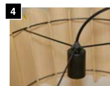
4 Firmly tighten socket to shade ring.