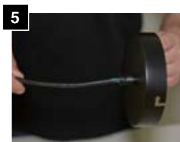
5 Feed cord through canopy.