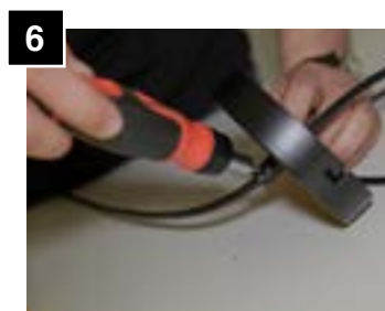
6 After adjusting cord length, tighten set screw on canopy.