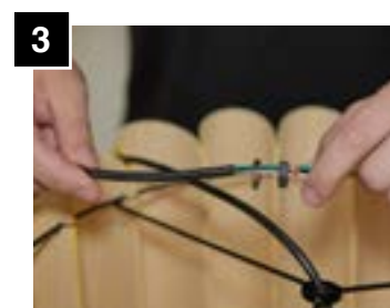
3 Pass lock washer and nut through cable.