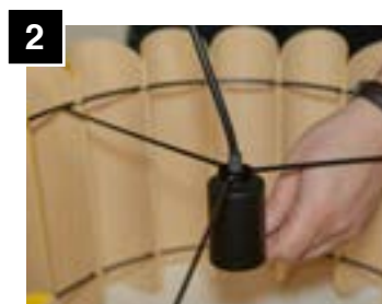
2 Pull cord until socket bottoms out.